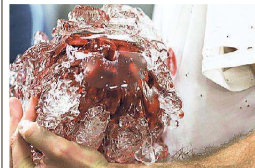
Una scultura di Marcantonio Brandolini d'Adda

Marcantonio Brandolini d'Adda vola a New York con la galleria Alma Zevi. La galleria veneziana debutta infatti nella Grande Mela con un allestimento site-specific che presenta una serie di sculture, astratte e imponenti, realizzate in vetro di Murano. In mostra, una serie di opere prodotte interamente a Murano all'inizio di quest'anno, e intitolate “Indefiniti”: si tratta di sculture in vetro corpose, audaci, la cui superficie viscerale sembra quasi chiedere di essere toccata. Il peso considerevole di ognuna di esse conferisce all'opera un senso di innata gravità e di irraggiungibilità fisica. Sensibile colorista, l'artista combina in maniera del tutto naturale vividi frammenti di vetro, detti cotissimi in dialetto muranese, i quali vengono uniti con lo strato