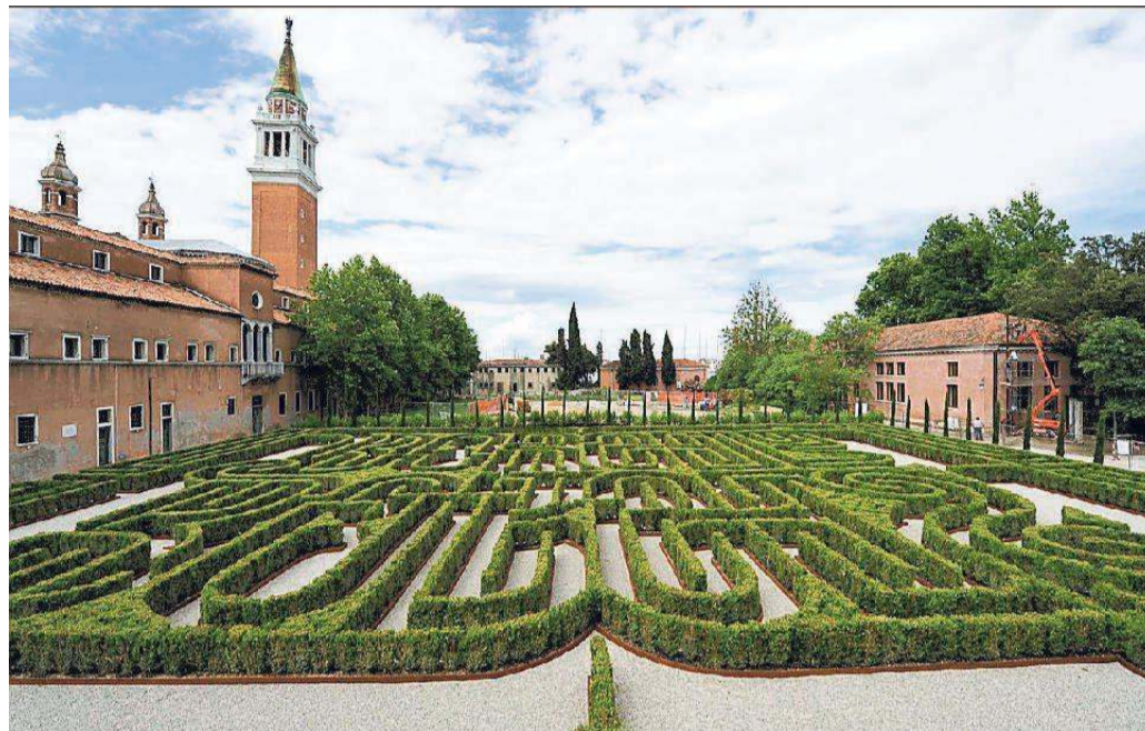
Anche il labirinto di Borges a San Giorgio sarà coinvolto nel festival