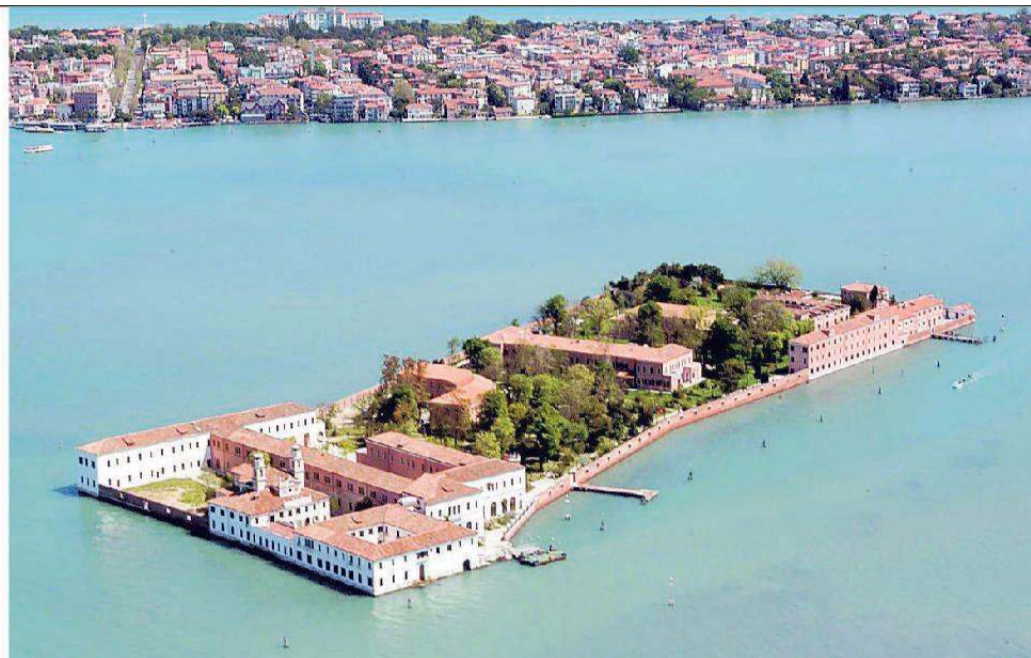
All'Isola di San Servolo un viaggio tra musica e parole, letture e musica dal vivo

Reading, laboratori, letture itineranti: ritorna il Festival della lettura, organizzato da BarchettaBlu, giunto alla sua dodicesima edizione e cresciuto fino a coinvolgere più di duemila persone. Da sabato 7 aprile a domenica 13 maggio saranno proposte moltissime attività dedicate alle famiglie, alle scuole, ad insegnanti, educatori, con letture ad alta voce, spettacoli di videostorie, racconti teatrali, laboratori e atelier creativi di costruzione del libro, percorsi formativi, letture itineranti, tutti all'insegna del motto "Libro che gira libro che leggi".