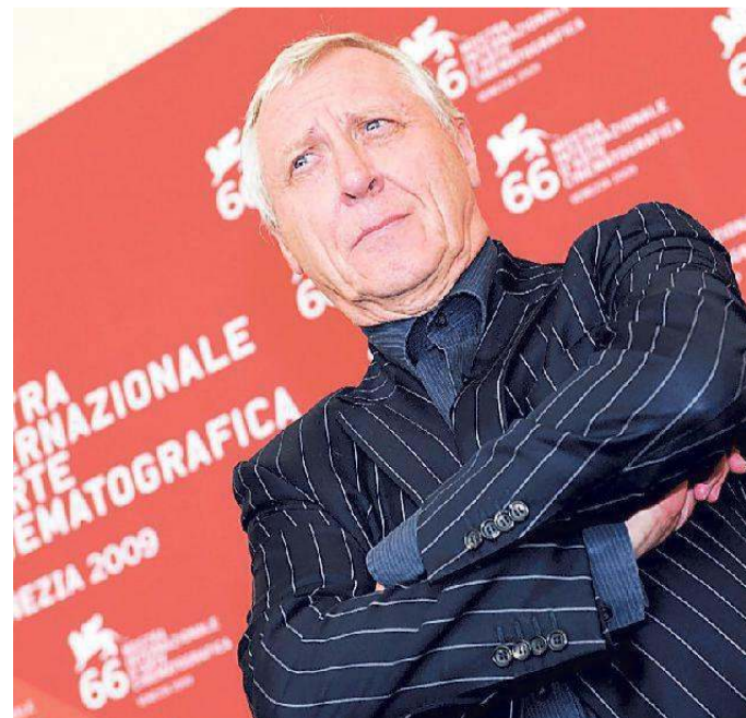
Il regista Peter Greenaway

nalista che vuole fare chiarezza su un evento delicato avvenuto su un'isola. Alle 17 salirà sul palco l'animatrice e regista indiana Gitanjali Rao presentando alcune delle sue opere più significative, in un programma a cura di Cecilia Cossio. Alle 18.30 sarà il turno della masterclass di Peter Greenaway, l'atteso artista e cineasta inglese, che verrà introdotto dal proretore alle attività e rapporti culturali di Ateneo Flavio Gregori. La giornata di oggi di Short Film Festival si concluderà alle 20 con altri cortometraggi del Concorso Internazionale.