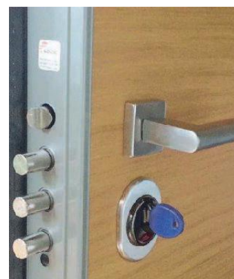
• Porte Blindate