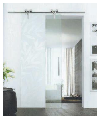
• Porte Interne