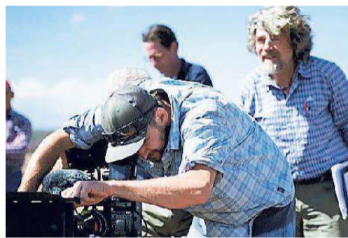
Messner, a destra, durante le riprese del suo film

Oggi al cinema Giorgione nel sestiere di Cannaregio a Venezia (ore 20, 30), secondo e ultimo appuntamento con la rassegna "Schermi verticali", organizzata in collaborazione con il Club Alpino Italiano - sezione di Venezia.