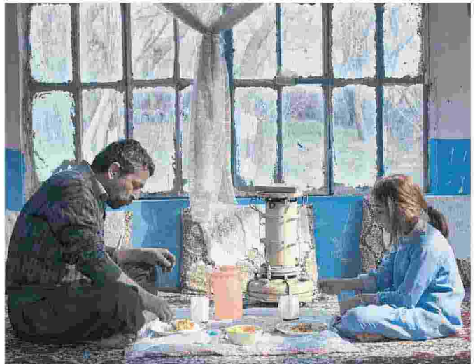
"Digari - The Other" di Zandkarimie e Hosseinpou (Iran) ha vinto il Ca' Foscari Short Film Festival

Il concorso di corti ha invaso i luoghi culturali della città Alta partecipazione nonostante le pause imposte dal Covid