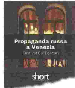
Sui social Una delle immagini di protesta diffuse dagli studenti sui social